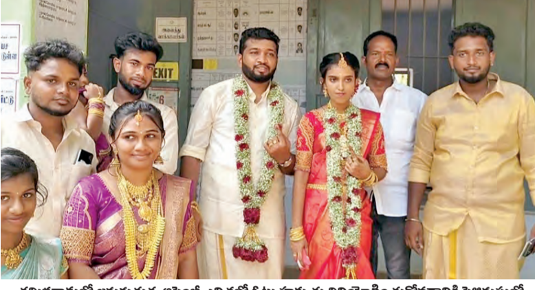
తమకనాడులో జరుగుతున్న అంబెడ్కే ఎన్ కౌంట్రీ ఓటు హక్కును వినియోగించుకోవడానికి వెళ్తున్న వారిలో నేరుగా పోలింగ్ కేంద్రానికి వచ్చిన వర్గాలవారు