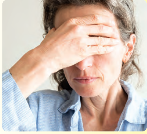
తేలికపాటి, మధ్యలో ఆగిపోయిన లేదా అలస్యమైన పీరియడ్స్ ఉంటాయి. కొంతమంది స్త్రీలలో సాధారణం కంటే ఎక్కువ రక్తప్రావం కావచ్చు. జననంపై మార్గం నిద్ర అలంకారాలు కలిగిస్తుంది. మెనోపాజ్ సమస్యలు లేవని నిర్ధారించుకోవడానికి, సాధారణ కంటే ఎక్కువ రక్తప్రామాన్ని వైద్యునిచే పరీక్ష చేయించుకోవాలి. మెనోపాజ్ పూర్వయే వరకు, పీరియడ్స్ తేలికగా ఉన్నా లేదా ఆగిపోయినా కూడా ఒక స్త్రీ గర్భవతి కాలేదని గ్రహించాలి.

చెలి బిట్టా.. - ప్రతిరోజూ నుదుటి మీద చందనం బొట్టు పెట్టుకుంటే జ్ఞాపకశక్తి పెరుగుతుంది. మార్కెట్ లో లభించే తిలకం ముద్రల్ని చందనంలో కుంచుకోవడం ఆర్థి పెట్టుకుంటే అందంగా ఉంటుంది. - పాదాలను నీళ్లలోనే ఉంచి వ్యూమిక్ స్ట్రోన్స్ పాదాల మీద, మదమల మీద వర్షానీ మూడు, నాలుగు నిమిషాల పాటు రుద్దండి. తద్వారా పాదాలపై పేరుకున్న మట్టి సులభంగా పోతుంది.