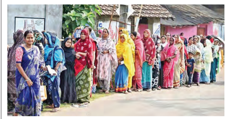
బెంగాల్ లోని నందిగ్రామ్ లో ఓటు వేసేందుకు క్యూలో ఉన్న ఓటర్లు

ఓటెత్తిన బెంగాల్ రాష్ట్ర చరిత్రలోనే అత్యధికంగా 92 శాతం పోలింగ్ తమిళనాట కూడా రికార్డు స్థాయిలో 84 శాతం బెంగాల్ పోలింగ్ హింసాత్మకం, బిజెపి అభ్యర్థులపై దాడి, వాహనాలు ధ్వంసం పలుచోట్ల రాళ్లు రుప్పిన ఘటనలు, లాఠీఛార్జి కోటేశ్వర / వెన్కటేశ్వర 23: దేశంలో రెండవ రాష్ట్రాల్లో జరిగిన ఎన్నికల్లో చరిత్రలోనే ఎన్నడూ తనంతగా ఓటర్లు పోలింగ్ కేంద్రాలకు వచ్చి తమ ఓటు హక్కు వినియోగించుకున్నారు. తమిళనాడులోని 234 స్థానాలకు ఒకే విధంగా జరిగిన ఎన్నికల్లో 84.51 శాతం ఓటు హక్కు వినియోగించుకున్నట్లు ఎన్నికల సంఘం ప్రకటించింది. సాయంత్రం ఆరు గంటలు దాటినప్పటికీ పోలింగ్ కేంద్రాల్లో బారులు తీరి ఓటర్లు వేచి ఉండటం ఓటు హక్కు వినియోగంపై పెరిగిన అవగాహనకు నిదర్శనంగా తెలుస్తోంది. రెండవ రాష్ట్రాల్లోను రికార్డు స్థాయి